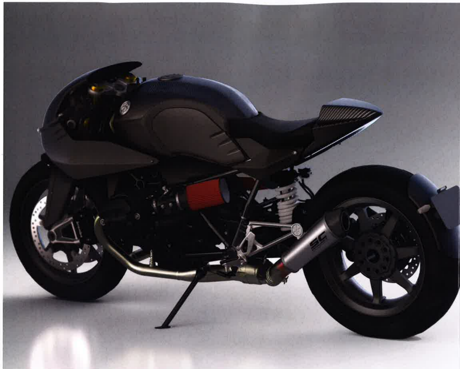
D'abord disponible en fibre de verre peinte façon alu, le kit sera aussi disponible en fibre de carbone (ci-dessus) et en fibre de lin, la marque de fabrication de la maison.

Plus habitué à réaliser des scramblers ou des trackers depuis son lancement en 2015, Dab Design s'attaque à un autre style incontournable de la préparation moto, le café racer. Plutôt que de